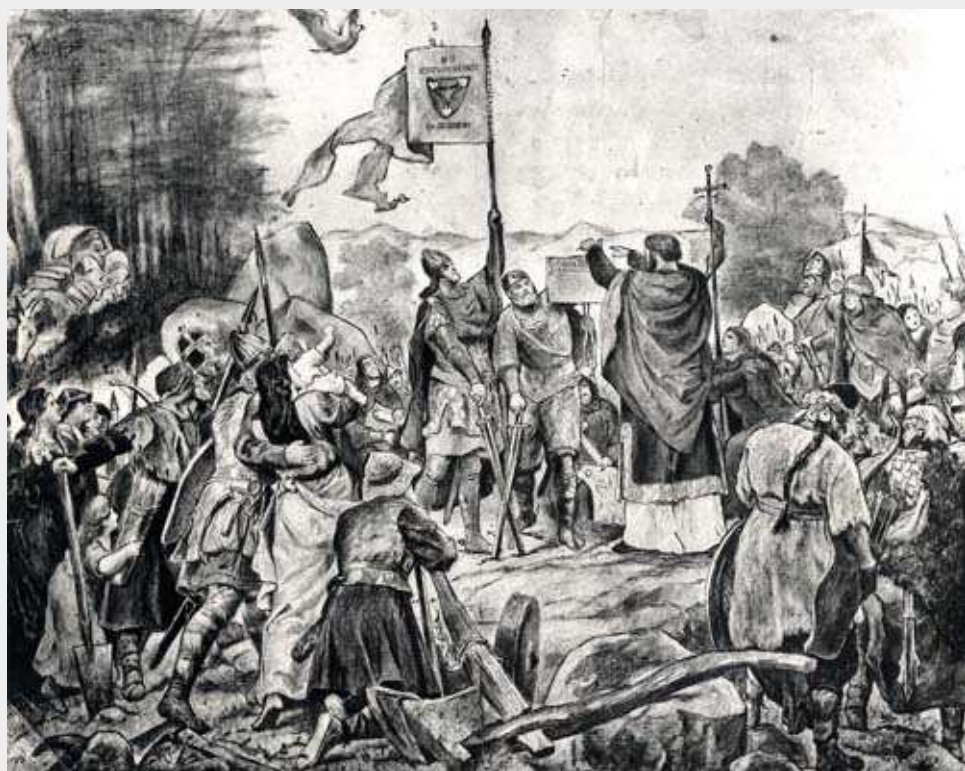
Die Einwanderer der Siebenbürger Sachsen. Von König Geisa II (1141-1162) vertragsmäßig berufen, nehmen deutsche Einwanderer das ihnen verliehene, bis dahin öde Land (desertum) an der siebenbürgischen Südgrenze in Besitz. Bild von Georg Bleibtreu 1828 - 1892 aus dem Jahre 1884.